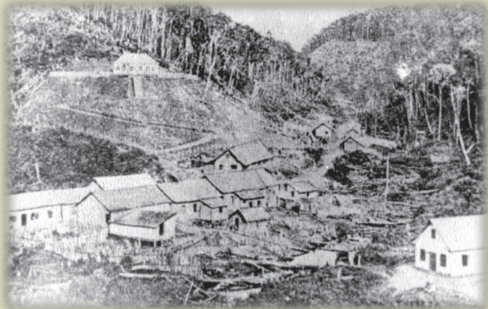
Povoação de Santa Teresa, sede do Núcleo Colonial do Timbuhy.