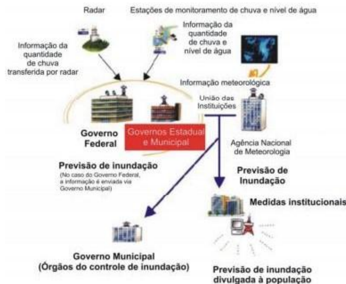
Figura 39 - Estrutura esquemática de uma rede de monitoramento e previsão de alerta.